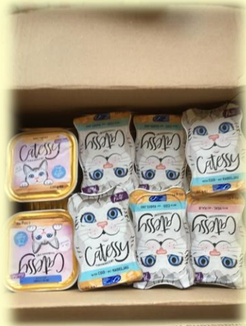
Via het forum