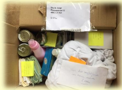
Loes via het forum