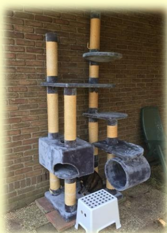
Twee krabpalen van Marjolijn