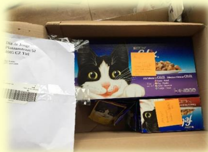
Bertus via het diabetesforum