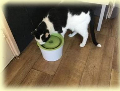
februari 2019: waterfontein februari 2019 Jip brokken