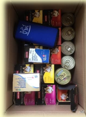
Jenny via forum