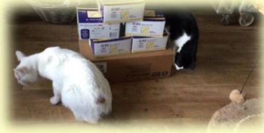
Januari 2019: spuitjes