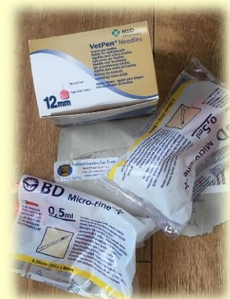
Familie van kat Bolle