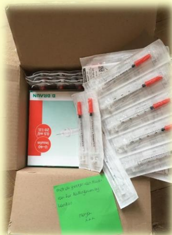
Mona via het forum